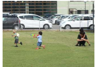
もらったおもちゃで早速遊びタイム★