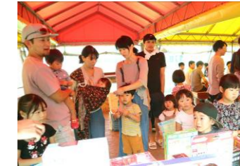
子供達のお楽しみ おもちゃどれにしようかな～