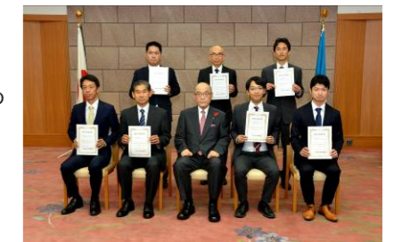
ネクストニッチトップ企業 写真中央: 石川県知事 谷本様

石川県の経済を牽引するものづくり中小企業による魅力ある新製品開発・販売開拓等の取り組みを支援するもの