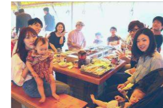
同世代のファミリーが集まりとっても賑やか♪