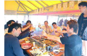
網の上は美味しそうなお肉でいっぱい

今年も恒例の清風会主催BBQが行なわれ、社員と家族を含む総勢79名が参加しました。晴天に恵まれ、外で走り回る子供たちを見てほっこり♪皆で楽しいひとときを過ごしました。準備してくれた幹事さん、お疲れ様です。