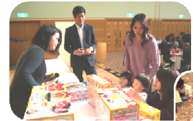
会場後ろは キッズスペースに 変身！