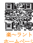
楽～ラント ホームページ

ホームページが公開されました。削減効果や動画など、詳しい説明が載っています。もしばらくしたらリニューアルする予定ですので、お楽しみに。