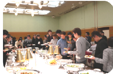
とっても美味しそうな お料理がずらり