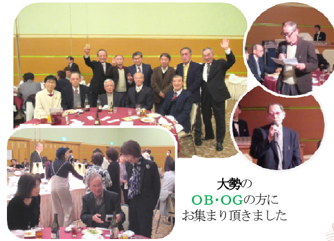
大勢の OB・OGの方に お集まり頂きました