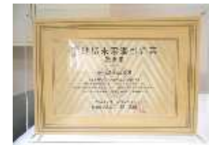
全国で1543社が選ばれました

地域未来牽引企業とは、地域の特性を生かして高い付加価値を創出し経済的波及効果を及ぼす事により、地域の経済成長を力強く牽引する事業を積極的に展開すること、または今後取り組む事が期待される企業が選ばれます。今後も積極的に事業活動に取り組み、地域経済の活性化へ努力して参ります。