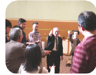
待ちました！！敗者復活 じゃんけん大会