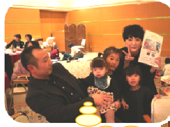
ビンゴ大会の目玉 旅行券 GET♪