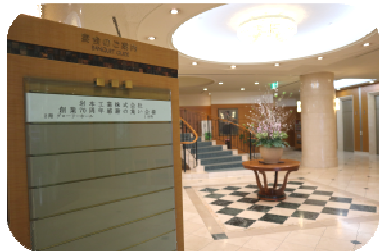
パーティーの始まり～♪

お陰様で無事、岩本工業株式会社“感謝の集い”を開催させて頂きました。お集まり頂いた社員とご家族、そしてOB・OGの方々を含む165名の皆様。又、この会に向けて多大な準備をされた社員の皆様にこの紙面をお借りして心より御礼を申し上げます。今回の社内報は特別に表一面をパーティの様子とさせて頂きましたのでご笑覧下さい。