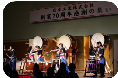
大迫力の太鼓演奏「DIA+」