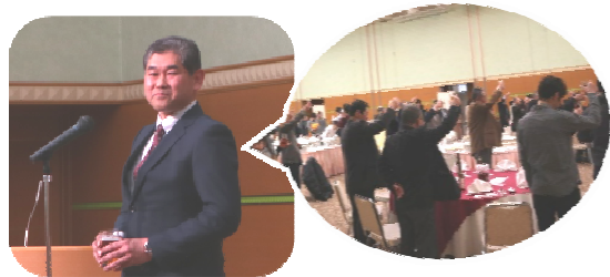
社長のご発声で → かんぱ～い！！